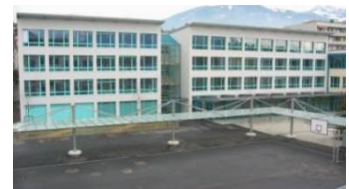
Collège de Kratzer Rue du Clos 1