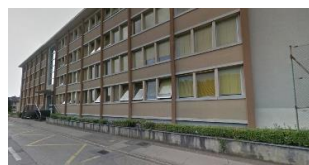
Collège des Crosets Avenue des Crosets 1