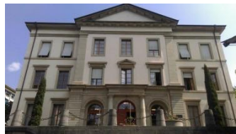
Ancien Collège Rue du Collège 360