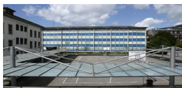
Collège du Bleu Rue du Panorama 2