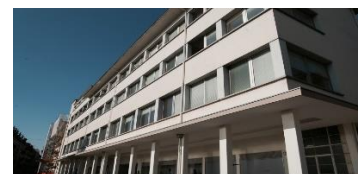
Collège des Galeries Rue Louis-Meyer 4